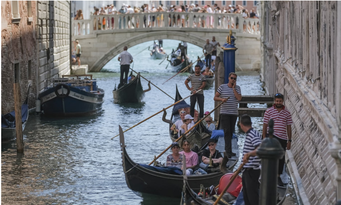
Εικόνα 1: Υπερτουρισμός στη Βενετία - Στιγμιότυπο (2024)

Κατά την άποψή μας, αρκετές αναλύσεις του «υπερτουρισμού», ως υπέρβαση της «τουριστικής χωρητικότητας» ζωνών υποδοχής, έχουν γίνει και παλιότερα, πριν από μερικές δεκαετίες. Δηλαδή, δεν έχουμε τώρα μια εντελώς νέα συζήτηση.